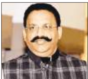
दौरान न सिर्फ उसे विशेष सुविधाएं दी गईं, बल्कि जिस मामले में पंजाब पुलिस उसको ट्रांजिट रिमांड पर लाई थी, उसका चालान भी पेश नहीं किया गया। रिपोर्ट में कहा गया है कि इस मामले में पंजाब पुलिस के कुछ अधिकारी भी जिम्मेदार हैं।

पुलिस ने चालान भी पेश नहीं किया: अंसारी पंजाब की रूपनगर जेल में जनवरी, 2019 से अप्रैल 2021 के बीच में बंद था। रिपोर्ट के अनुसार जेल में बंद रहने के