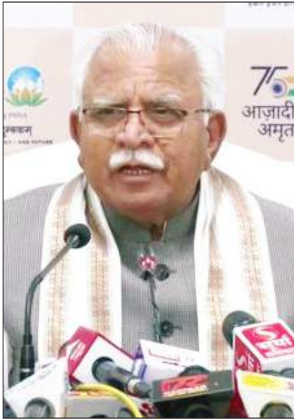
मीडिया को संबोधित करते हुए हरियाणा के सीएम मनोहर लाल खट्टर।